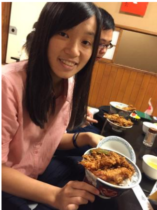
(很贵的天婦羅蓋飯-大黑家)