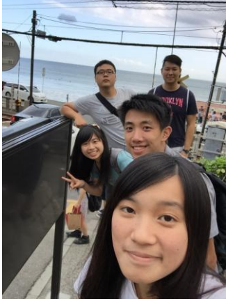
(鎌倉江之島一日遊)