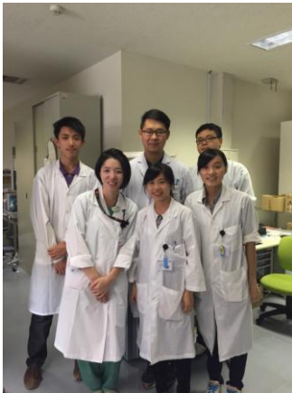
(會講中文的學姐-前排左一)