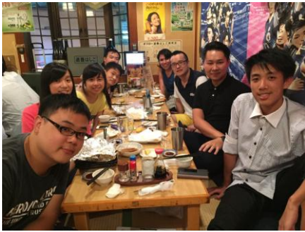
(與在NCC認識的上海台灣墨西哥醫生們吃飯)