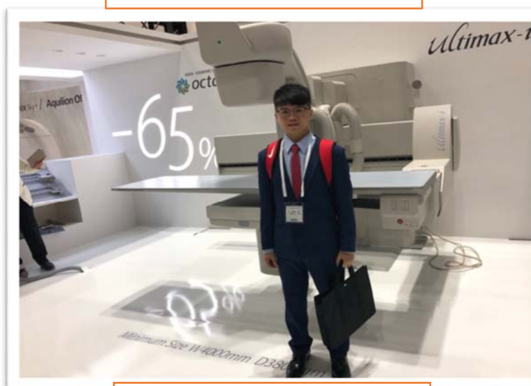
減少 65%劑量的透視 x 光機

古人說：『讀萬卷書，行萬里路』，學了諸多的書本知識，這次我們來到了一年一次位於日本的 JRC (2019)儀器展，其展覽內容囊括了放射的三大領域，包含放射診斷、放射治療、核子醫學。