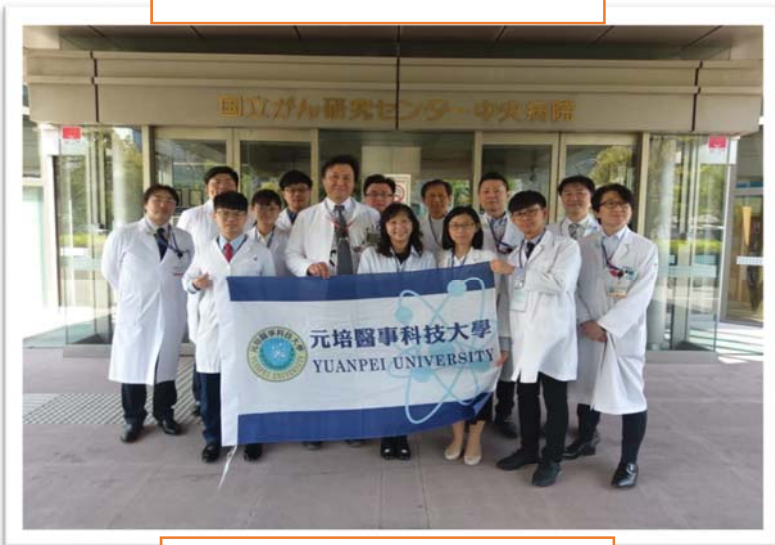
東京國立中央病院