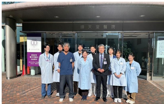
順天堂醫院門口團體照

作為在國際標準臨床研究等方面發揮核心作用的國內核心醫院，厚生勞動省將順天堂大學醫院列為「臨床研究中核醫院」。