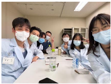
每個部門結束的開會