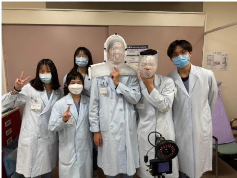
在 RT，前輩讓我們做的 mask