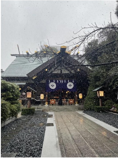
下大雪的東京大神社