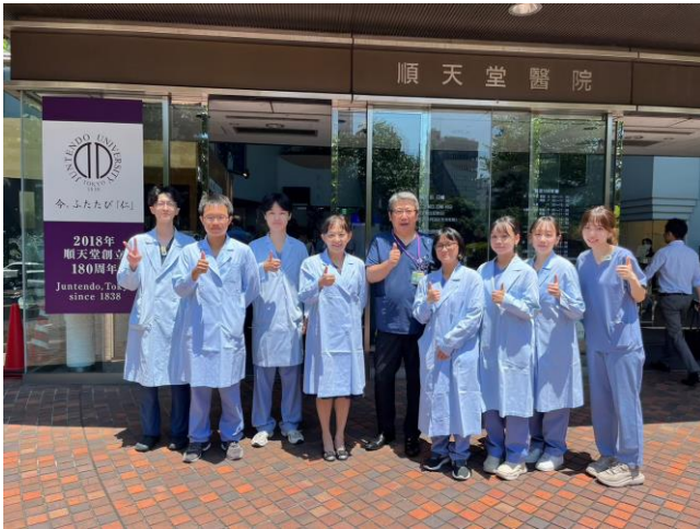
順天堂醫院大門的合照

第一天進到順天堂醫院，醫院的一位中文技師負責引導我們，先讓我們換上醫院放射師專用的工作服，與台灣醫院不同的是，在順天堂醫院，放射師主要的工作袍為藍色，所以我們帶來的白袍並不適用。換上衣服後，放射師便帶領我們介紹醫院的每個部門